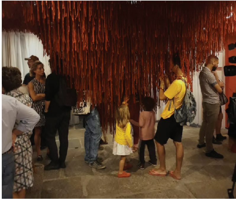
Figura 14 Instalação com fios de lã na exposição Angel Vianna no Paço Imperial, Rio de Janeiro

Observando o uso do espaço, identificou-se que muitos visitantes expandiram os limites de seus corpos, experimentando as propostas da expografia: via-se crianças brincando e interagindo com os dispositivos como forma de apreensão dos conteúdos, mais timidamente, adultos colocaram seus corpos em posições não controladas, sem pudor ou medo de retaliação, experimentando outros modos de estar com o corpo presente no espaço. Voltar a brincar e entender que cada corpo é um corpo e que qualquer corpo dança, conforme defende Angel Vianna, revelou-se, na expografia, uma possibilidade.