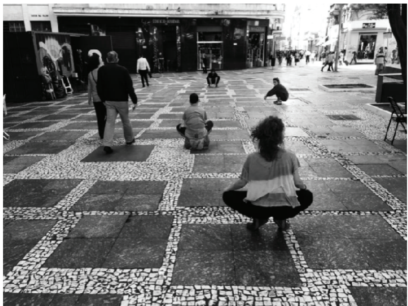
Figura 5, 6

Núcleo de pesquisa A estufa, o Corpo e a Cidade. Exercícios de experimentação do corpo com elementos arquitetônicos na cidade. Vale do Anhangabaú, São Paulo; Exercícios de criação de enquadramentos e cenas relacionando os corpos presentes. Largo São Francisco, São Paulo