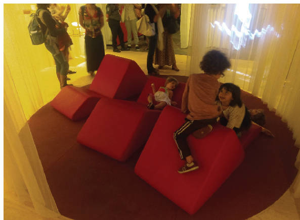
Figura 11, 12

Espaço central da exposição com elementos e dispositivos disparadores de atenção ao corpos; Crianças brincando no espaço central. Ocupação Angel Vianna, São Paulo