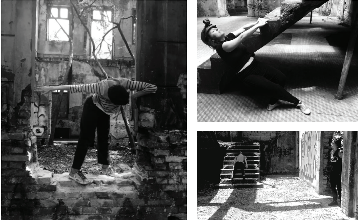
Figura 1, 2, 3

Núcleo de pesquisa A Estufa, o Corpo e a Cidade. Exercícios de experimentação entre o corpo e arquitetura (1,2) Experimentação com o corpo em estado performativo para composição de cenas e enquadramentos junto à arquitetura (3), Vila Maria Zélia, São Paulo (2,3)