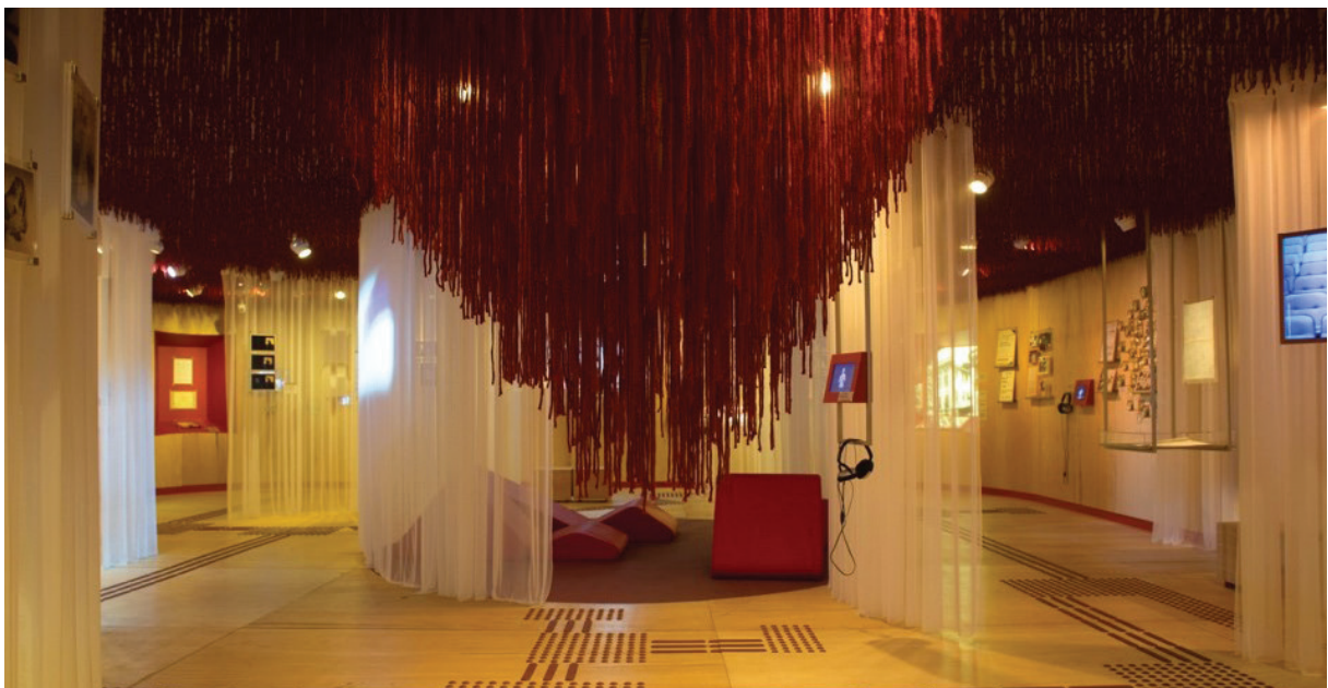
Figura 7, 8, 9 Processo de projeto para expografia da Ocupação Angel Vianna; Transposição do desenho do movimento para a planta baixa (7, 8). Vista Geral Exposição Ocupação Angel Vianna (9)