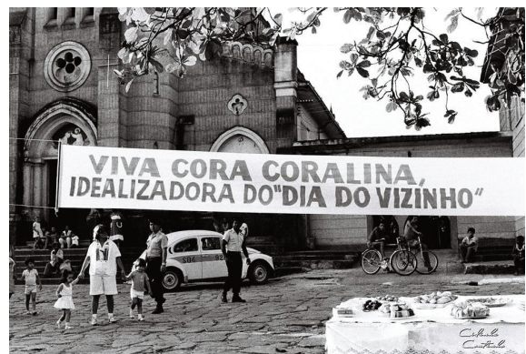
Figura 8, 9, 10, 11

Apropriações e usos cotidianos da Praça do Coreto pela comunidade local em meados do século XX;