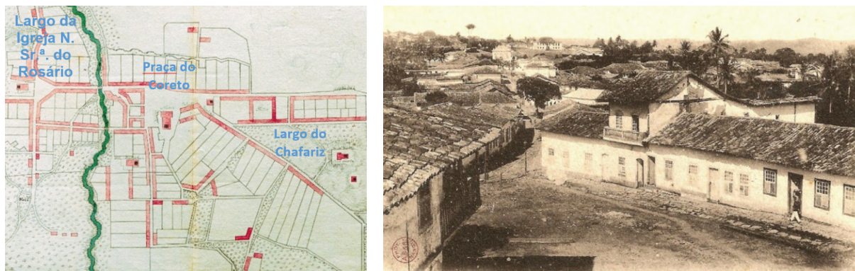
Figura 1, 2

cada de 1930, a Igreja de N. Sr. a do Rosário) e Largo do Chafariz (maior espaço livre da região central, implantado em 1739, após a vila tornar-se capital, para abrigar a Casa de Câmara e Cadeia, o Chafariz da Boa Morte e o desaparecido Pelourinho, além do Quartel do XX e do Colégio Santana).