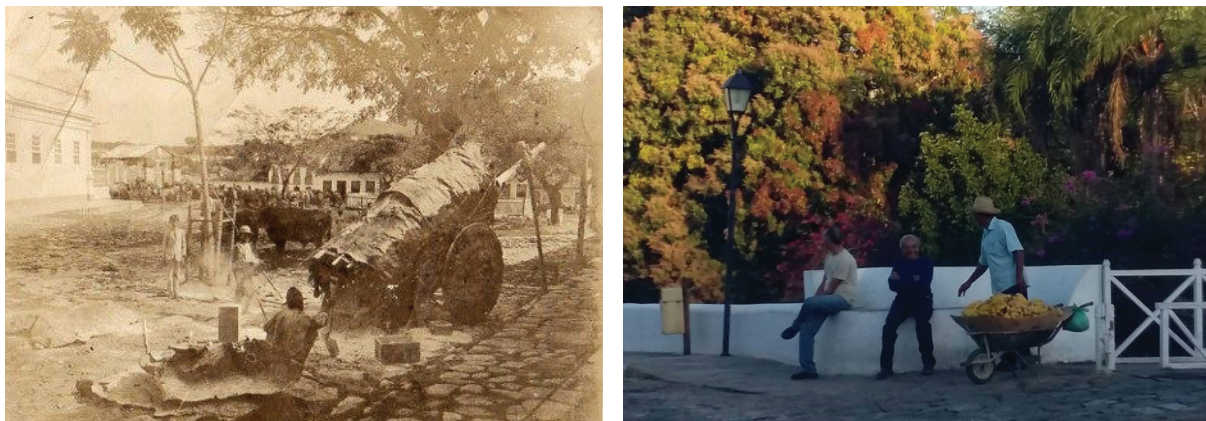
Figura 4, 5

das pelos indivíduos ou grupos presos nessas “redes de vigilância” e consideradas como uma espécie de “criatividade dispersa, tática e bricoladora” (Certeau, 1998, p. 41). Na cidade de Goiás, ilustrariam essa condição: as conhecidas e simbólicas lavadeiras que trabalharam no Rio Vermelho até meados do século passado (Figura 6); os vendedores informais de produtos rurais, espalhados por alguns pontos do centro histórico como a Praça do Coreto (Figuras 4 e 5) e que permanecem até a atualidade; entre outros.