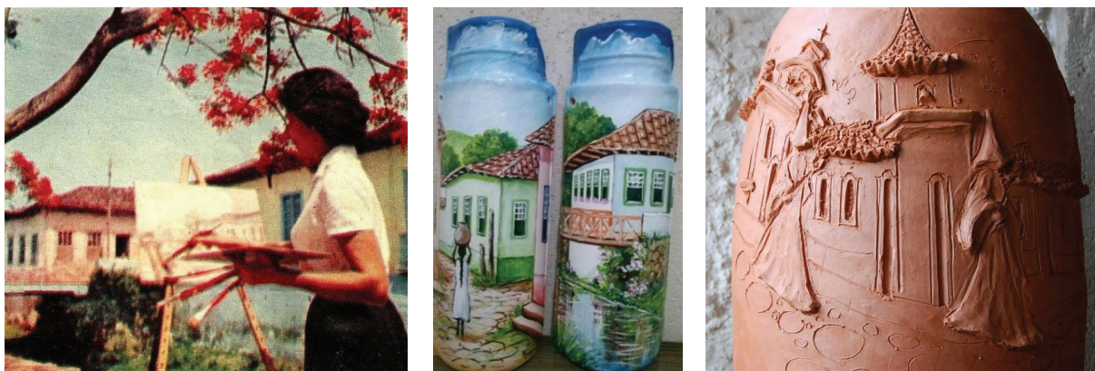
Figura 12, 13, 14

o espaço, ainda que um se aproprie do outro. Sugere também que se estimule a existência de espaços lúdicos em quantidade e qualidade, “superando (ao reunir) uso e troca” (Lefèbvre, 2001, p. 132), de modo a gerar movimento, imprevisto e encontros para as pessoas da cidade. Enfim, na forma do patrimônio cultural, por exemplo, “os tempos-espaços tornam-se obra de arte e que a arte passada é reconsiderada como fonte e modelo de apropriação do espaço e do tempo”, como “qualidades temporais inscritas em espaços” (Lefèbvre, 2001, p. 134).