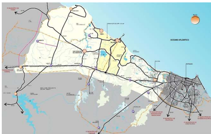
Figura 3 – Área de Influência imediata do CIPP.