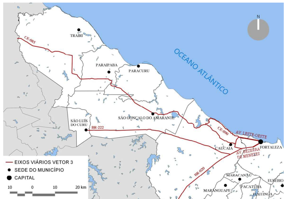
Figura 1 - Estrutura viária básica do Eixo Oeste de expansão da RMF.

O eixo oeste constitui um dos chamados vetores de expansão urbana que conformam o modelo 4 de crescimento de Fortaleza, segundo o qual “o processo de expansão da RMF obedece a uma estruturação radial, que reafirma os antigos caminhos e, posteriormente, os eixos viários que se dirigiam para o interior e porções leste e oeste da faixa litorânea, a partir da Capital” (SMITH, 2001, p.06). Este vetor se desenvolve em direção aos municípios da zona norte do Estado e ao longo da faixa litorânea oeste, relacionado primeiramente aos conjuntos habitacionais construídos na área limdeira à BR-020 em Caucaia, reforçado posteriormente pelas ocupações de segunda residência na