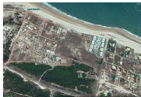
Figura 5 – Condomínios de lazer. A esquerda, Condomínio Summerville; à direita, Wai Wai Cumbuco Eco Residence.

Há também os condomínios de lazer (figura 5), surgidos recentemente - e em grande número -, que vieram substituir os antigos loteamentos de residências de férias e fim de semana. São empreendimentos com características diferenciadas, compostos de unidades residenciais de alto padrão, relacionados com veraneio marítimo. Os usuários em geral são habitantes da Capital, de nível de renda elevada, ou ainda investidores estrangeiros.