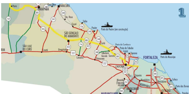
Figura 7 - Via Estruturante com grandes loteamentos residenciais situados às suas margens.