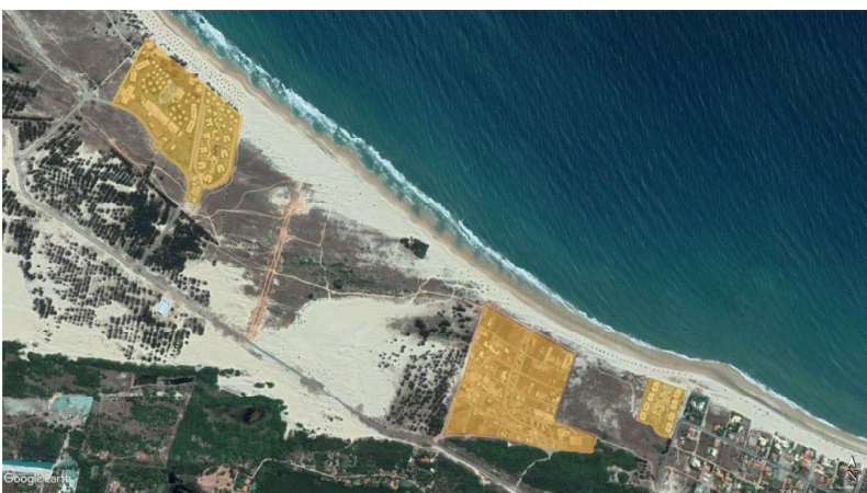
Figura 4 – Ocupação da orla (Praia do Cumbuco) por resorts e condomínios de lazer.