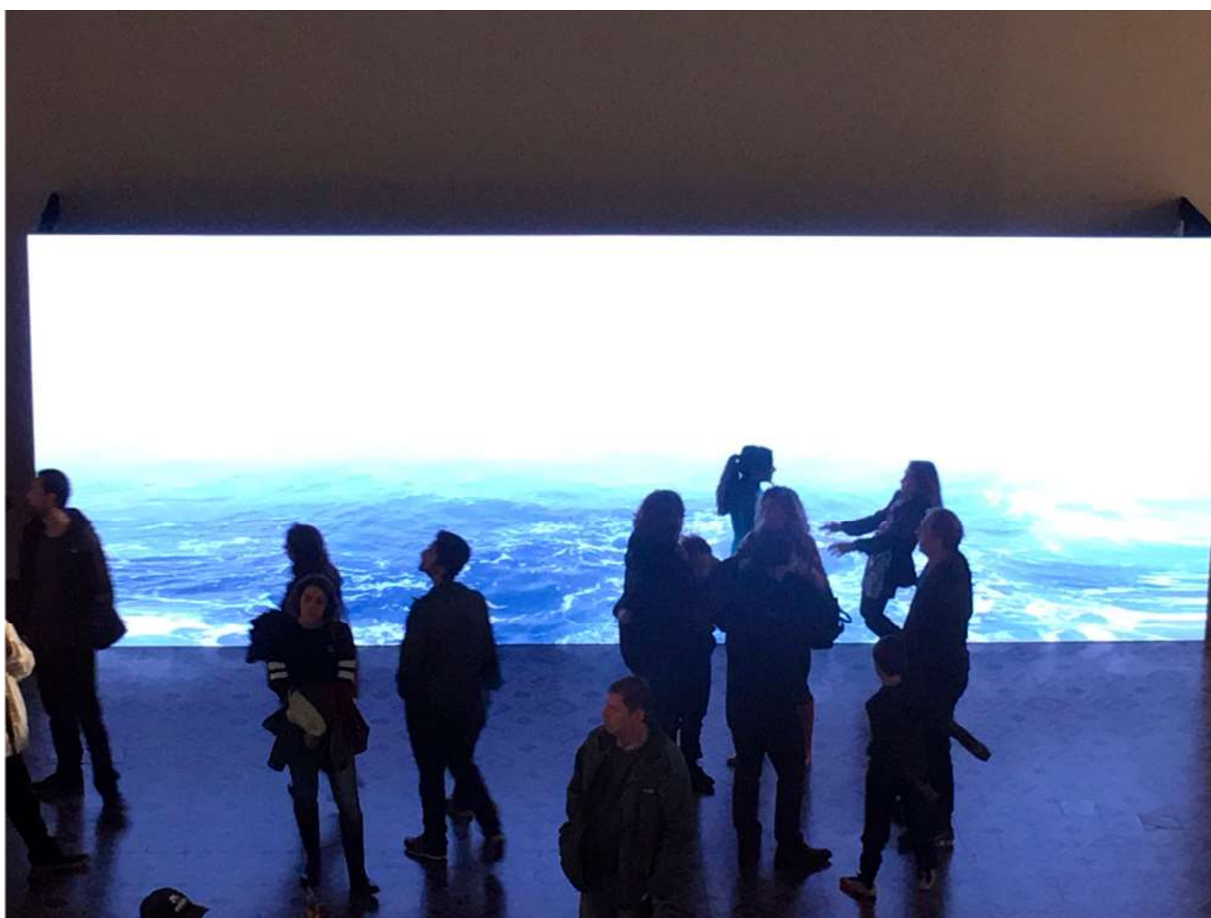
Figura 1 – MARGS-Noite dos Museus 2018.