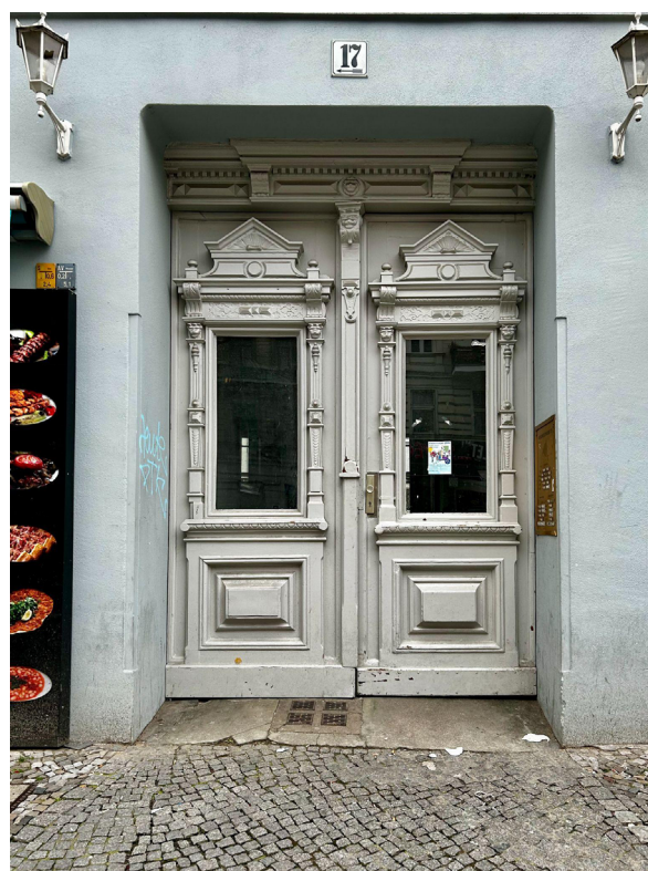
Figuras 13 e 14

Aspectos da cidade de Berlim, na Alemanha.