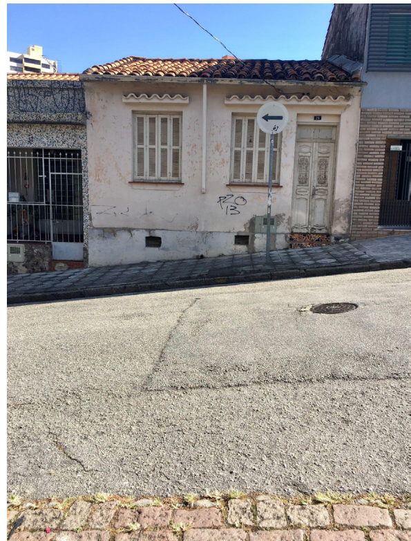
Figuras 3 e 4

Aspectos da cidade de Sorocaba, no interior de São Paulo.