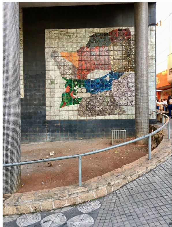
Figuras 7 e 8

Aspectos da cidade de Sorocaba, no interior de São Paulo.