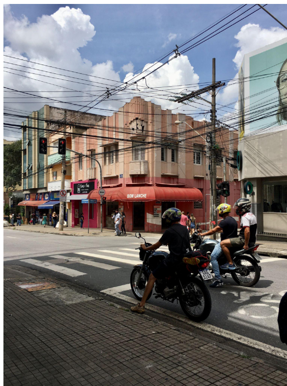
Figuras 5 e 6

Aspectos da cidade de Sorocaba, no interior de São Paulo.