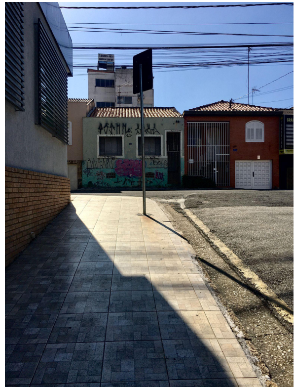
Figuras 1 e 2

Aspectos da cidade de Sorocaba, no interior de São Paulo.