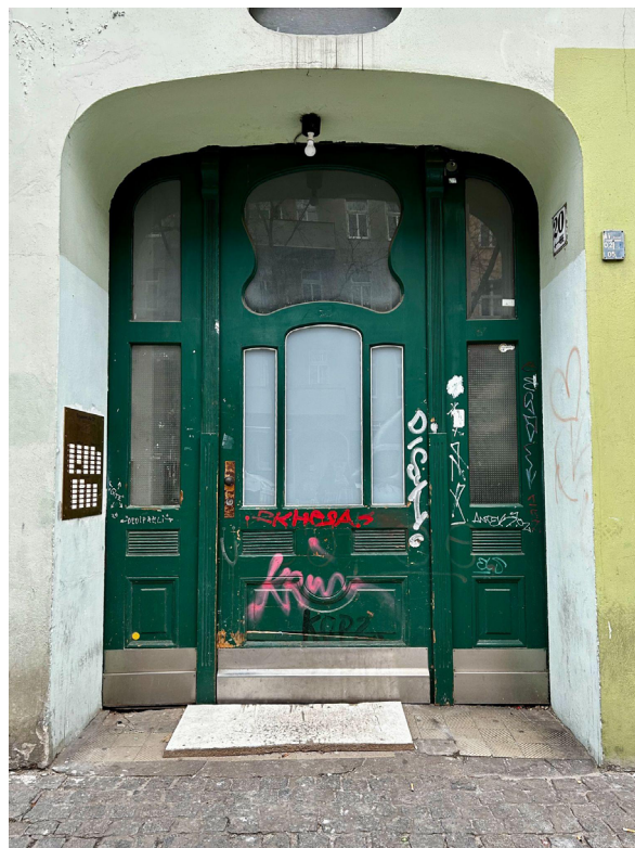
Figuras 9 e 10

Aspectos da cidade de Berlim, na Alemanha.